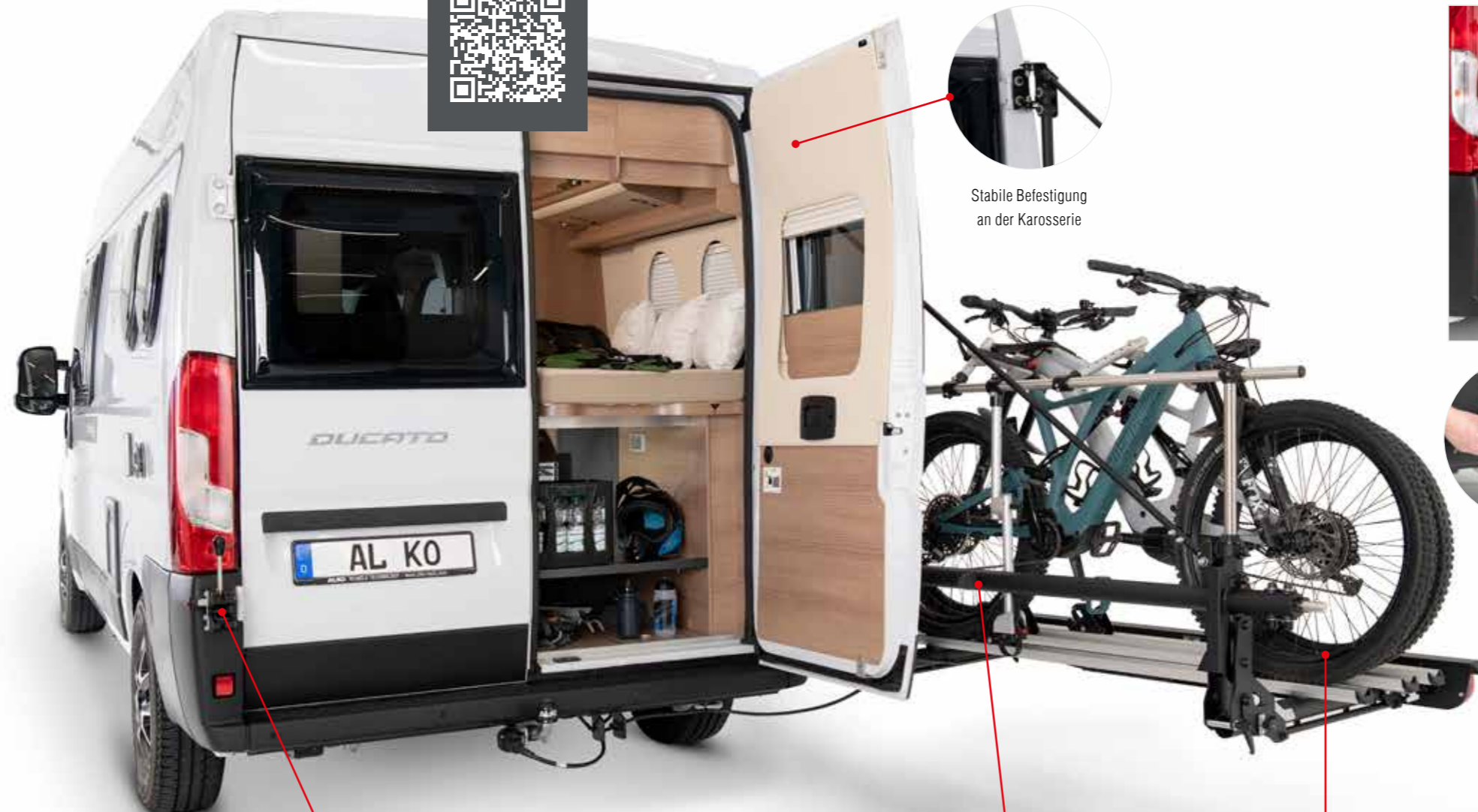
Stabile Befestigung an der Karosserie