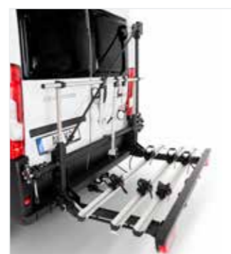
Rüstsatz für 3 E-Bikes oder Fahrräder