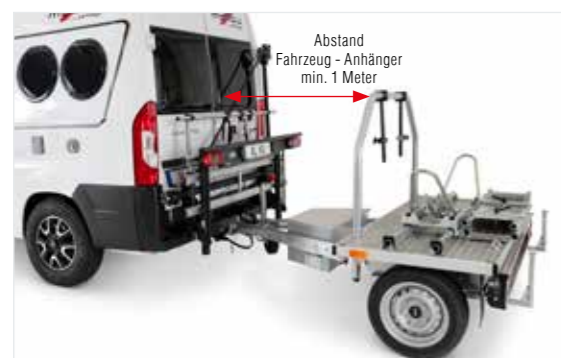
Anhängerkupplung uneingeschränkt nutzbar