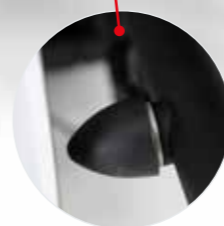
Stabiler Schutz vor Beschädigung der Hecktüren