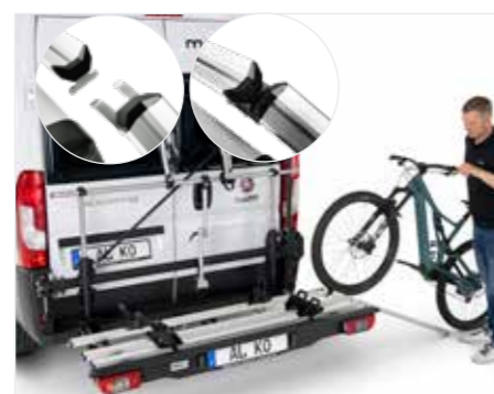
Komfortabel beladen, auch per Rampe