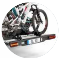
Hochwertige LED-Leuchten mit dynamischem Blinker