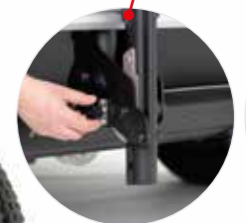
Sichern per unkomplizierter Arretierung