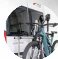
Ausreichend Platz auch für große Bikes