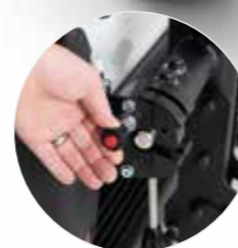
Einfach und gefahrlos entriegeln und schwenken. Verriegelung rastet automatisch ein