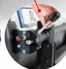
Verriegelung mit Schloss sichern (nicht im Lieferumfang enthalten)